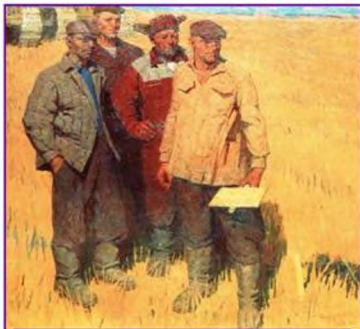
«Мои земляки» 1964