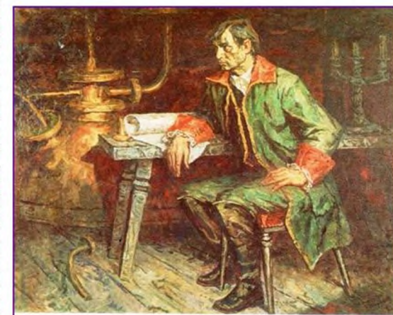
«Иван Ползунов» 1972