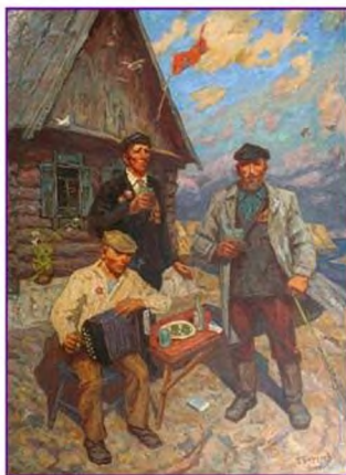
«9 Мая. Рядовые Победы» 2000

В 1995 году художник стал лауреатом премии алтайского Демидовского фонда. А в 1998 году ему присвоено звание лауреата премии Алтайского края в области литературы, искусства, архитектуры и народного творчества.