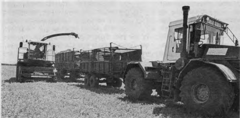
Идет погрузка сенажа